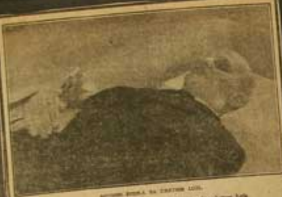
ROVNANÉ PRŮVA, NA ZÁPADNÍM LÍCI.

Had bavení slunce žít, slunce žít a žít, slunce žít, bavení žít, a ty žít žít žít!