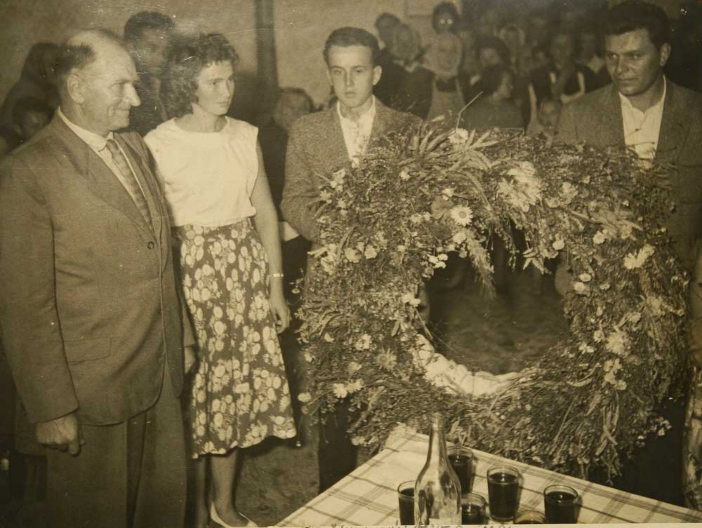
DOŽÍNKOVÝ YENEC 1961.