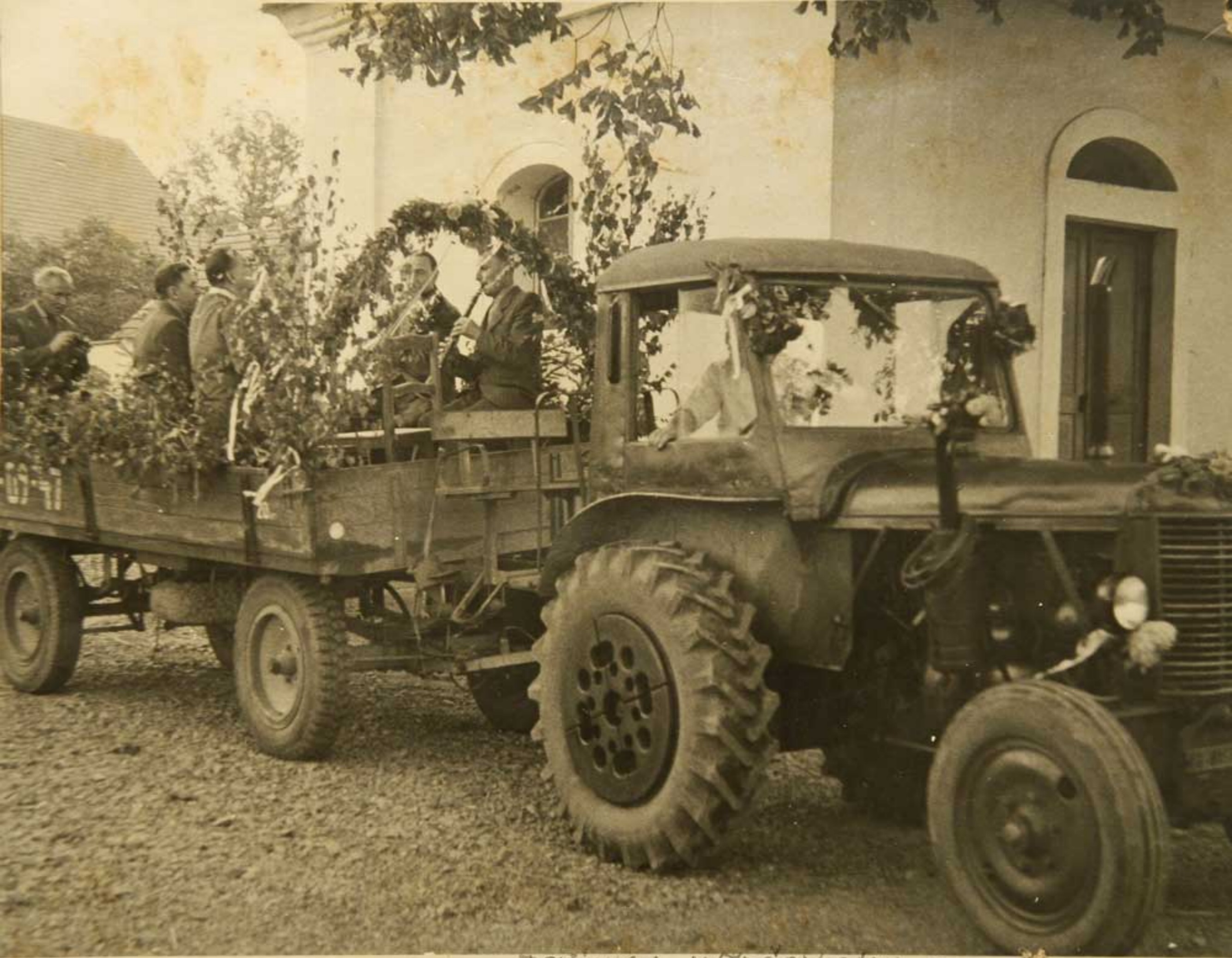
DOZINKY v ČECHOVICÍCH.