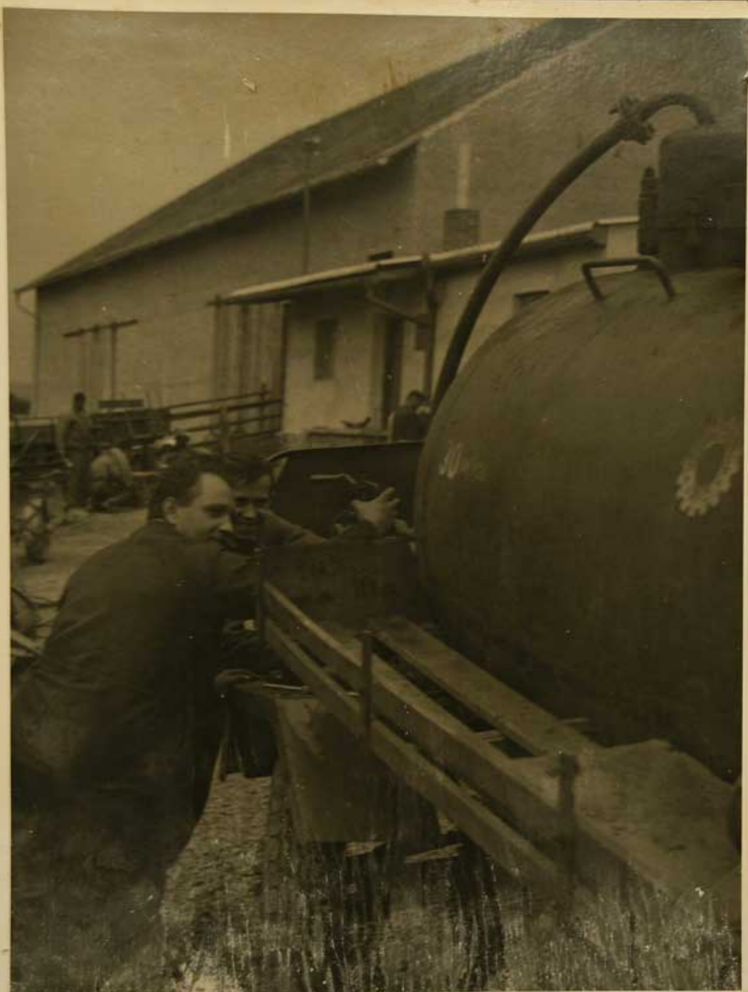
PŘI STAVĚ CERPACÍ STANICE.