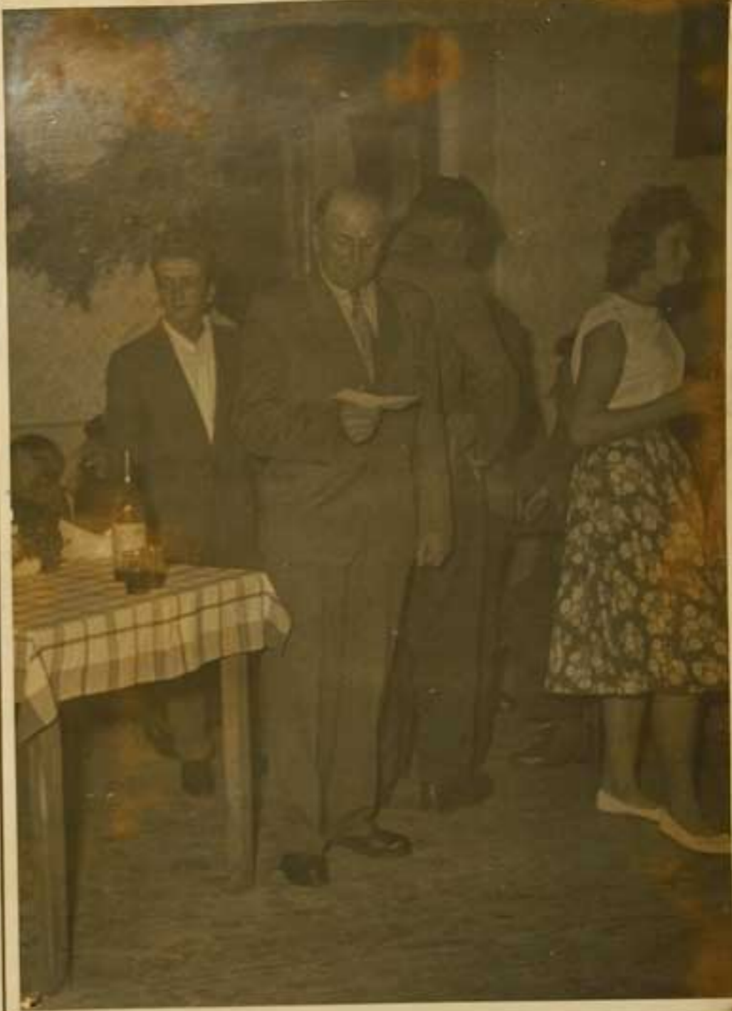
DOXINKY JZD Šteary