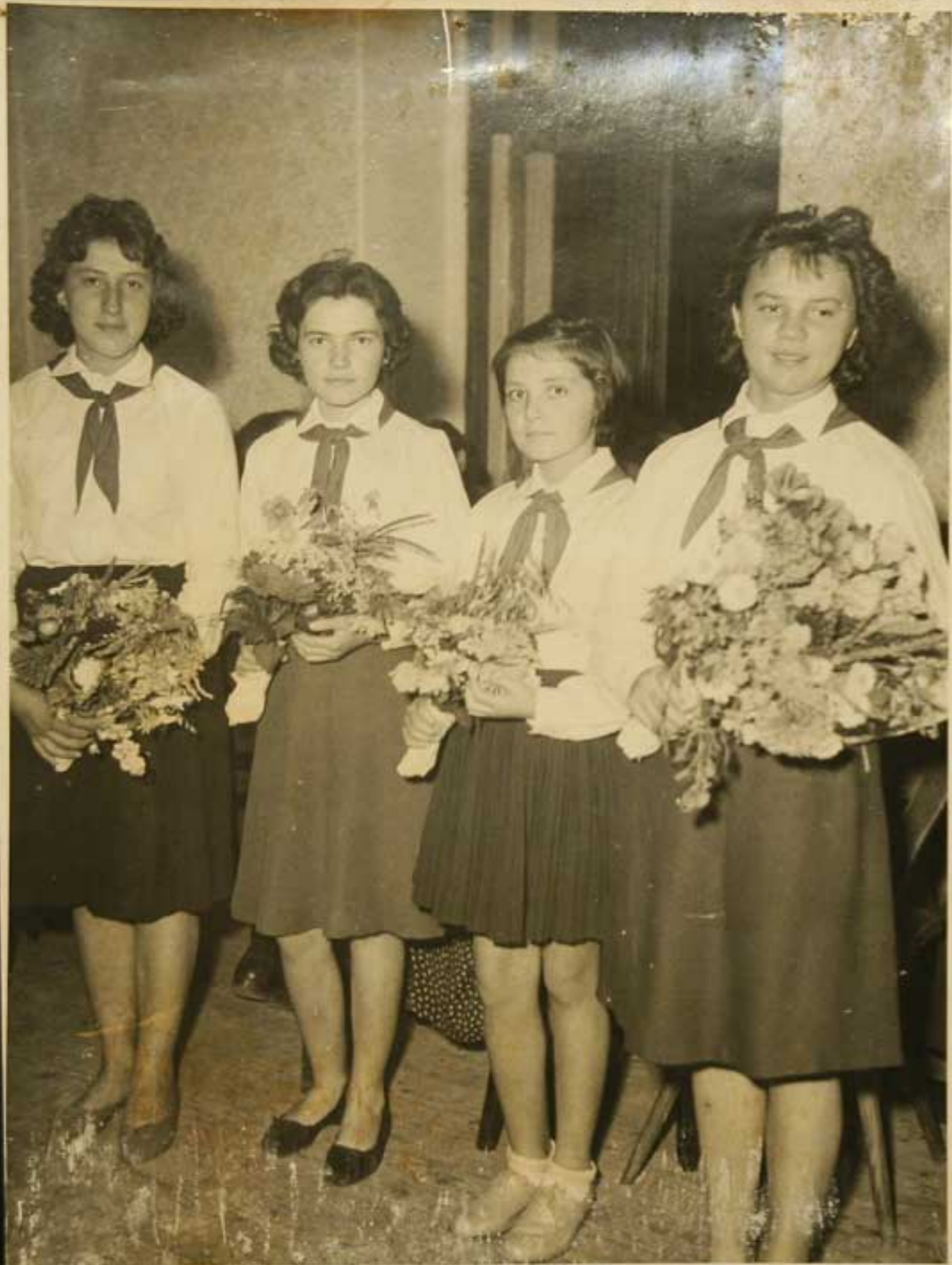
SECOVICKA DUCATA DOXINKY 1961.