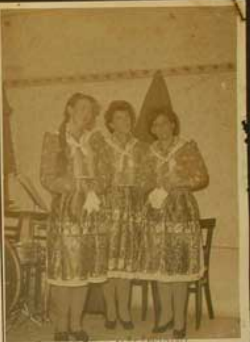
Členky třídy v ústředí.