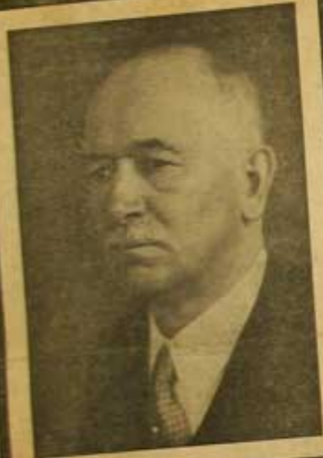
Dr. Edvard Beneš, druhý prezident Československé republiky, zemřel v pátek 3. srpna v 18.10 hod. ve své vile v Sezimově Ústí. Osvědčení lékařů vydáno v pátek v 10.20 hod. této zprávy. Dr. Edvard Beneš se nacházel během odpoledne z bezvědomí. Kolem 15. hod. nastala agonie a v 18.10 hod. zemřel. Dr. Edvard Beneš umřel v úterý, bez zjevné příčiny, podle lékařů v Náchodské nemocnici v kruhu své rodiny.