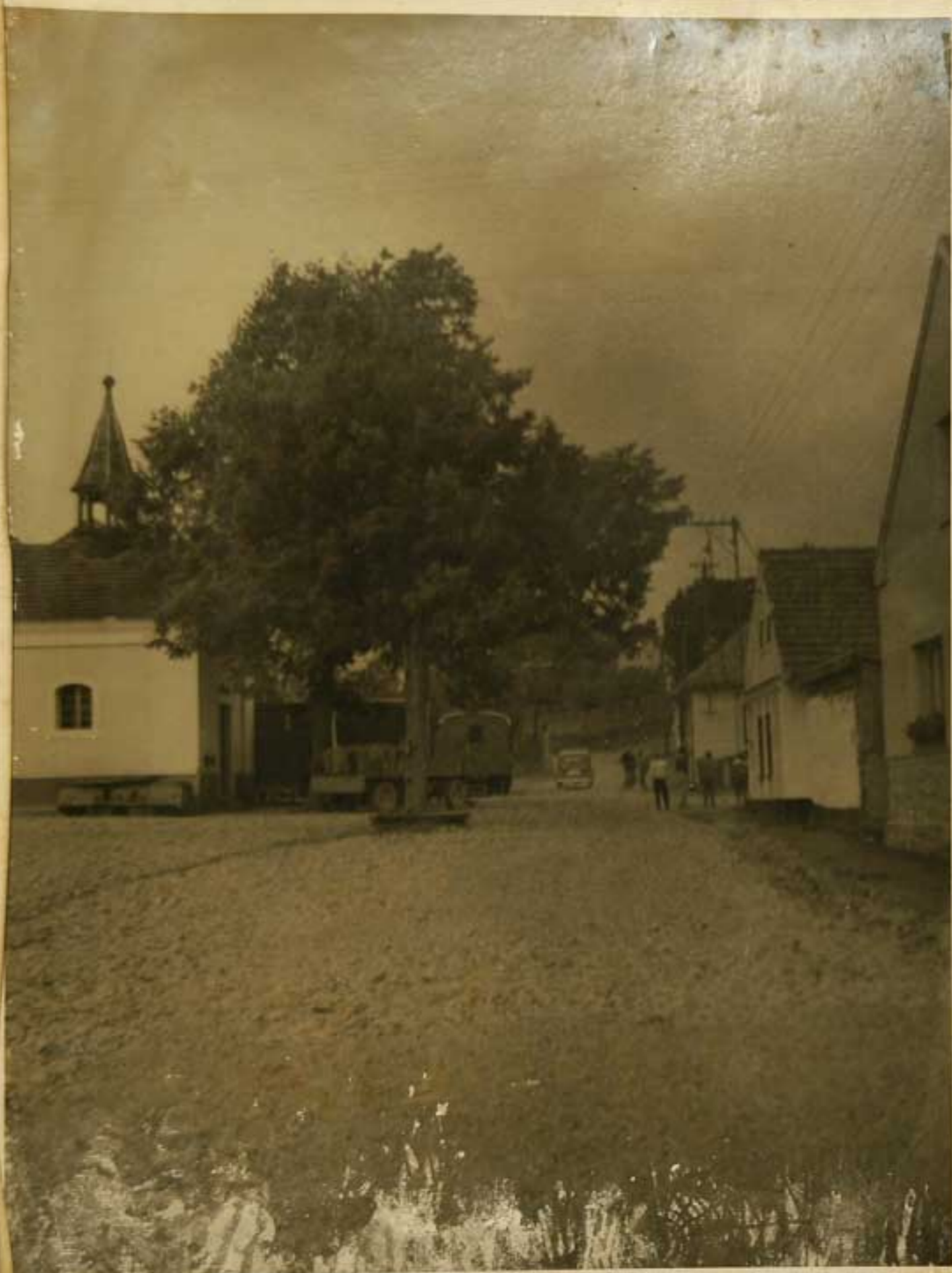
PRIL. KOLEYANIM ASPALTEM.