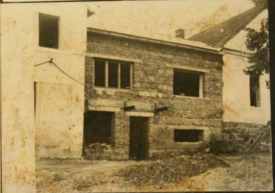
Okolo stavby kulturního domu v Čečovicích.