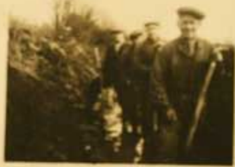
Regulace pozemku v Čecovicích. -