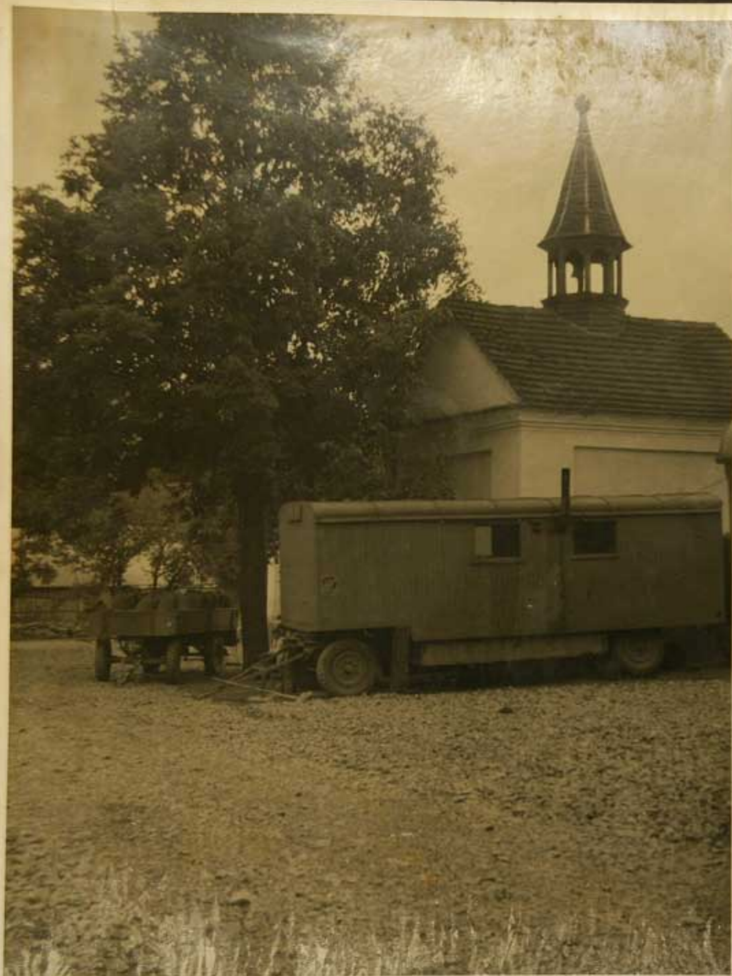
ASEFAZ OVIVNI STANICE KRES NAVES!