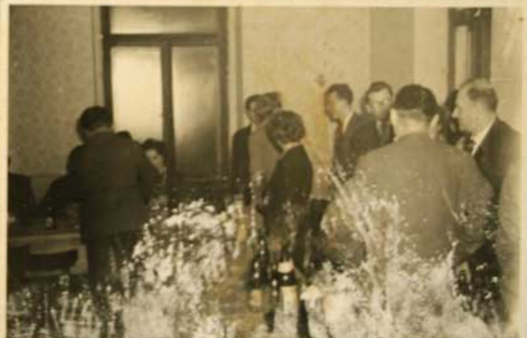
SOVĚTSKÍ ZEMĚDĚLÉ V LEDY CI. - 16