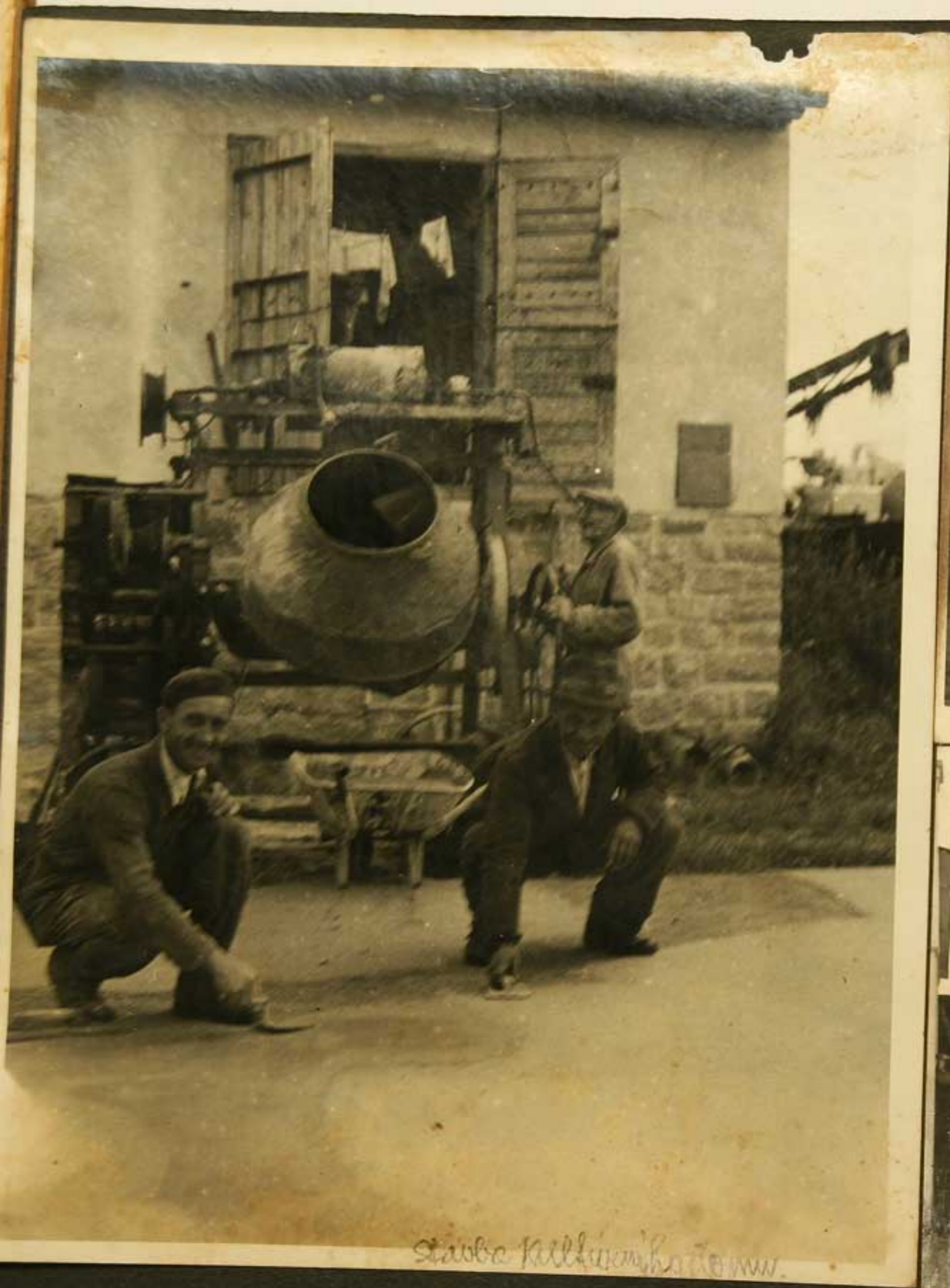
Stable Killybegs, Co. Down.